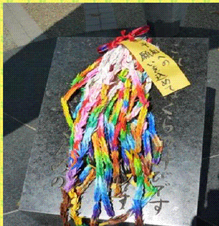
平和への願いを込めて 千羽鶴を