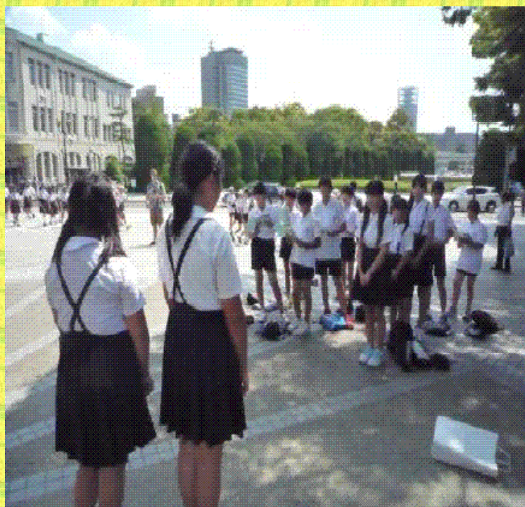
平和公園でのセレモニー