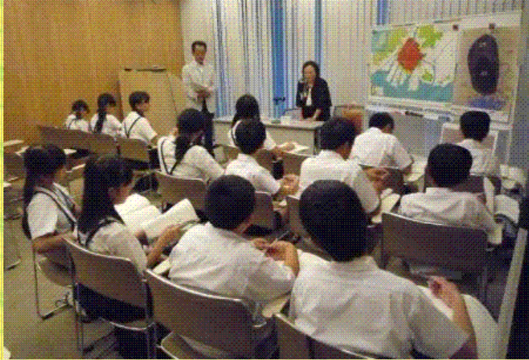
被爆者の方(語り部さん)からの話