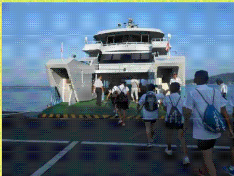
フェリーで宮島へ